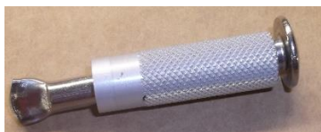
Piton inox à cheville