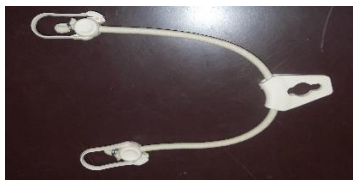
Sandow de tension avec platine et crochet